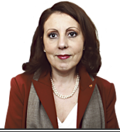
Maria da Graça Carvalho