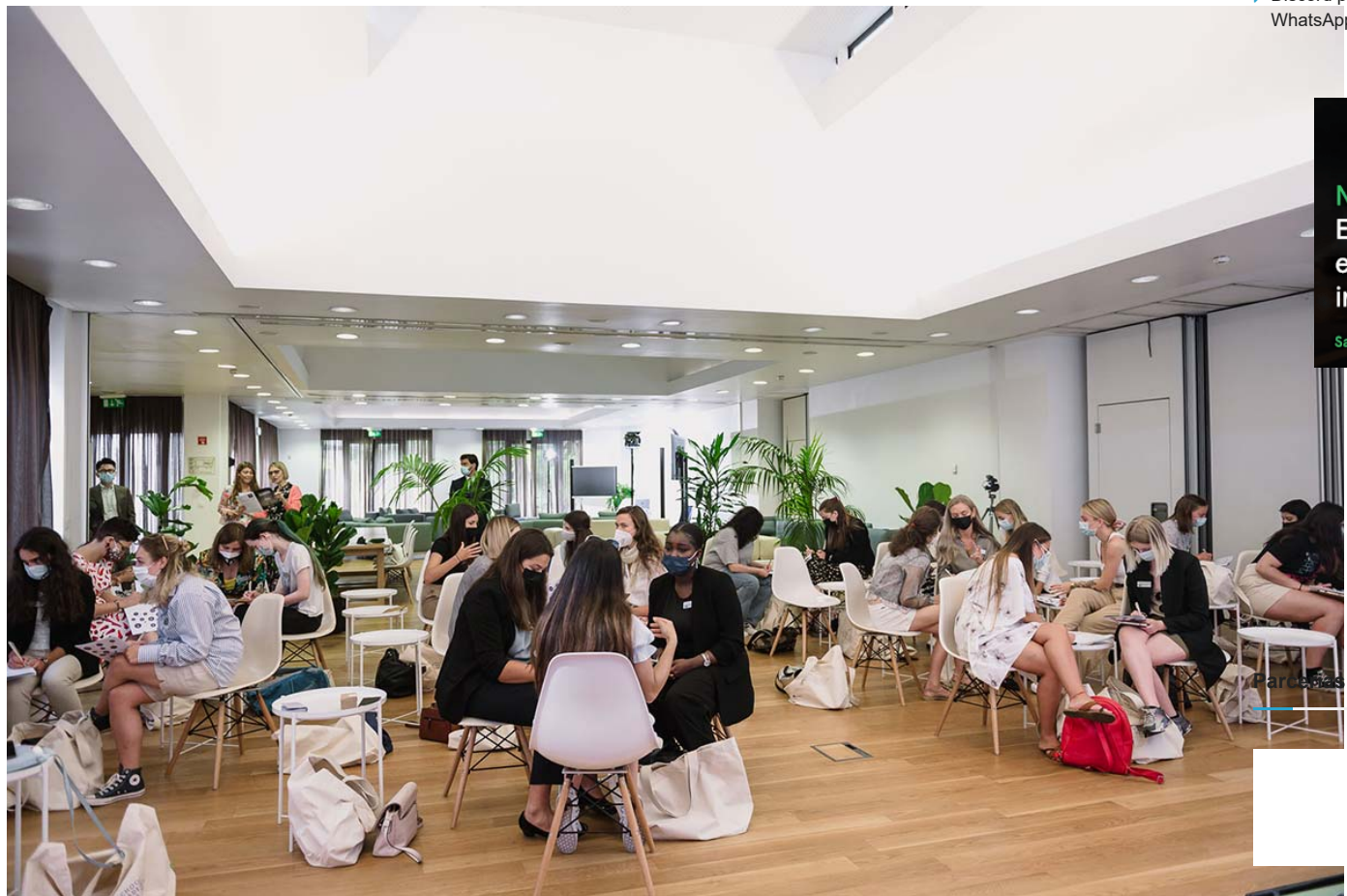
As 27 participantes foram eleccionadas entre mais de 1200 candidaturas por um júri presidido pela Eurodeputada Maria Manuel Leitão M